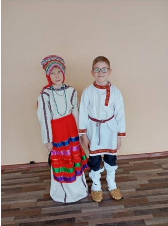
Набор украшений №4